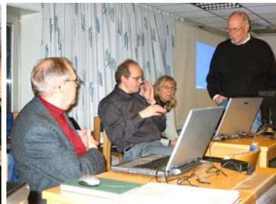
Nogle fotos fra mødet den 5. april 2006